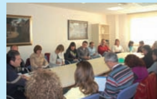
Diversos colectivos locales se dieron cita en la reunión convocada por el Ayuntamiento

En el mes de Febrero tuvo lugar en la sala de reuniones del Ayuntamiento de Yunquera la primera toma de contacto con representantes de los distintos colectivos que forman el tejido social del municipio, a fin de tratar sobre la creación del Consejo Escolar de Localidad. Este órgano ha sido creado como medio para garantizar la participación y consulta en la programación general de la enseñanza no universitaria en el ámbito municipal. La iniciativa para la creación del Consejo Escolar de Localidad corresponde al Ayuntamiento, que es el encargado de elaborar un reglamento de funcionamiento en el que se debe determinar su composición, así como las funciones de sus miembros.