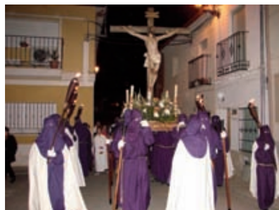
Los actos celebrados durante la Semana Santa contaron con gran participación a pesar de que el tiempo no acompañara, incluso en algunos la lluvia se hizo presente pero no obligó a la suspensión de ninguno de ellos. La Banda de Cornetas y Tambores contó con la incorporación de nuevos efectivos, brillando a un gran nivel en todas las procesiones.