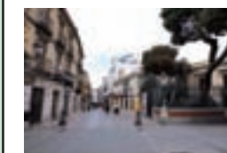
Calle Mayor de Guadalajara