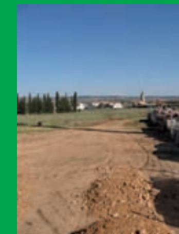
El nuevo centro de salud estará ubicado detrás de la plaza de toros