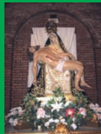
Semana Santa 2009 en fotos

Premio otorgado por la Junta de Comunidades al desarrollo local sostenido, respetuoso con el medio ambiente y los recursos naturales