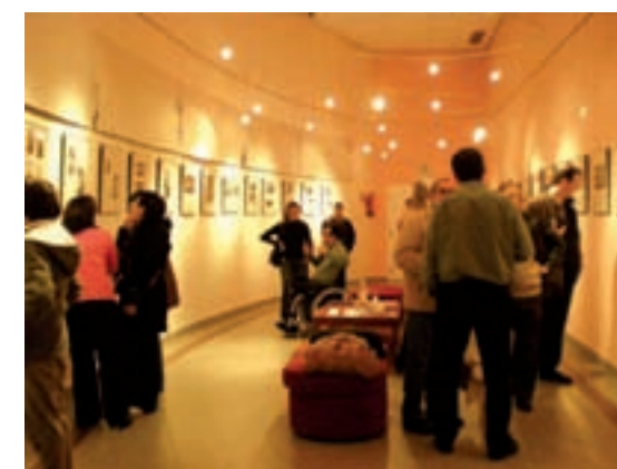
La imagen capta un momento de la inauguración