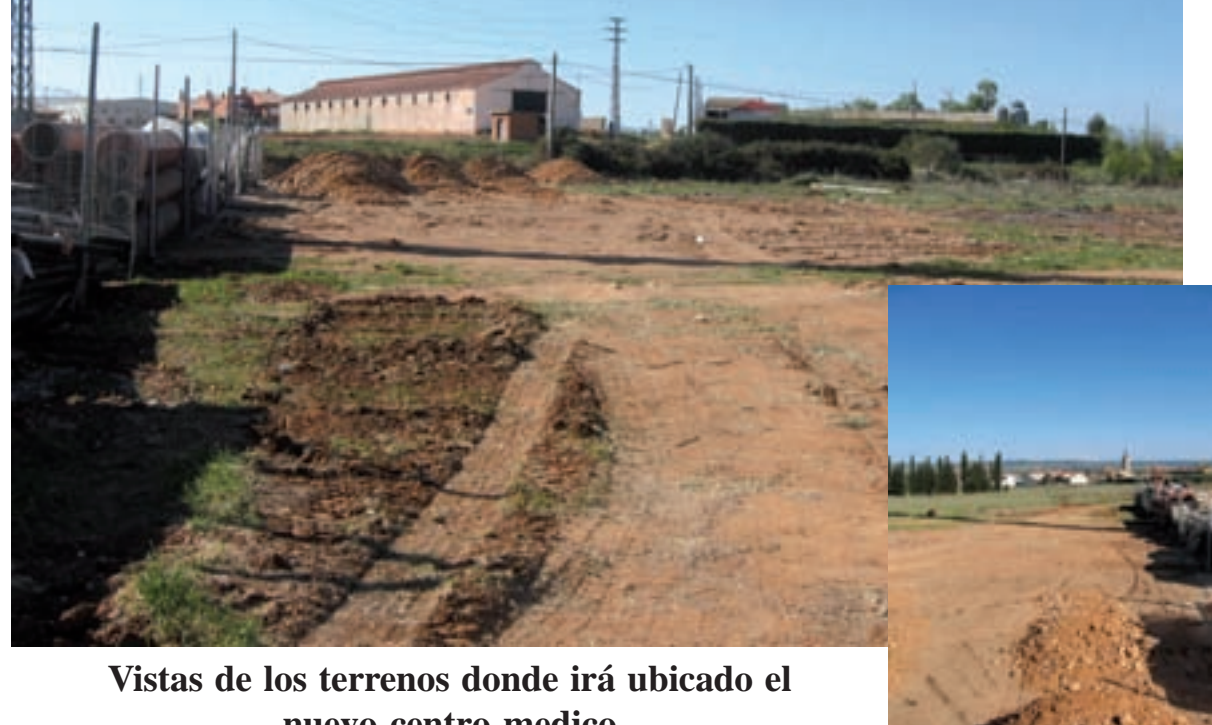
Vistas de los terrenos donde irá ubicado el nuevo centro medico

Los terrenos elegidos son los situados detrás de la plaza de toros