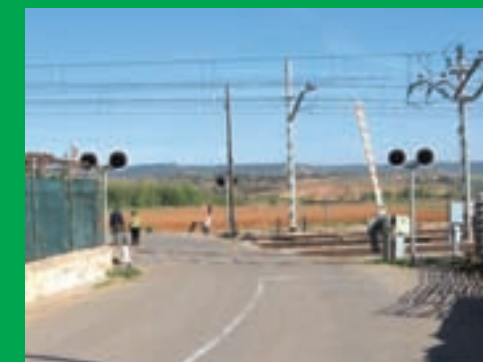
ADIF, eliminará el paso a nivel de la vía de ferrocarril Madrid-Barcelona a su paso por la localidad