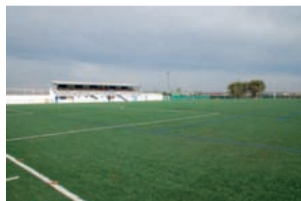
Algunas de las instalaciones deportivas y culturales con las que cuenta el municipio