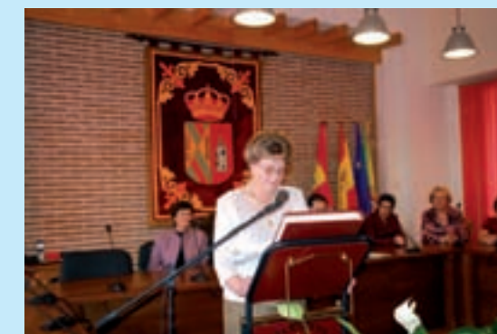
La alcaldesa 2009 prestando juramento

Las 13:15 fue la hora fijada en el salón de actos del Ayuntamiento para entablar la tradicional charla coloquio, en la que el alcalde del municipio contestó una por una a todas las preguntas que le dirigieron miembros de la asociación de mujeres sobre el estado actual de la localidad, tomando buena nota para intentar resolver algún que otro problema en el plazo más breve posible. Seguidamente se trasladaron a Guadalajara para compartir mesa y mantel en un conocido restaurante capitalino.