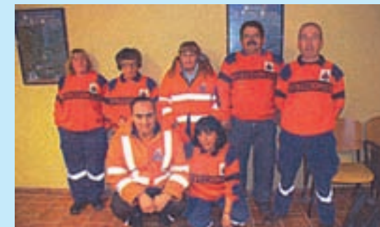
Miembros de la Agrupación de Voluntarios de Protección Civil en Yunquera de Henares