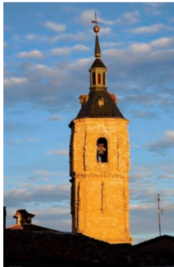
Magnífica vista de la torre de San Pedro al atardecer