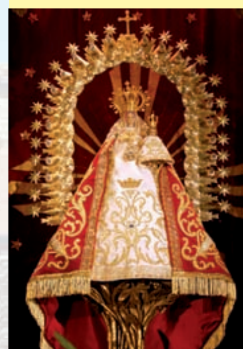
La fiesta en fotos