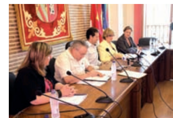
Momento de la firma del convenio