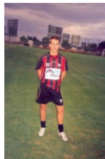
Con la elástica del C.D. Azuqueca