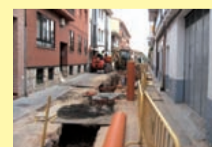
En marcha la renovación de redes