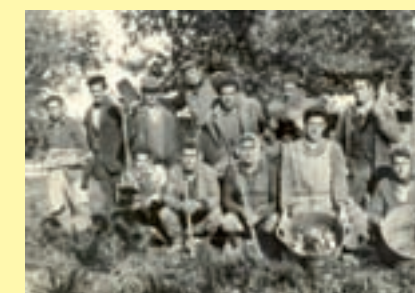
Album de recuerdos: «Patateros»