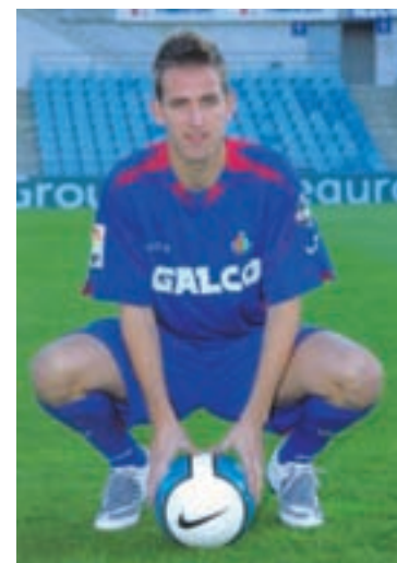
Muy cerca de 1º con el C.D. Getafe B