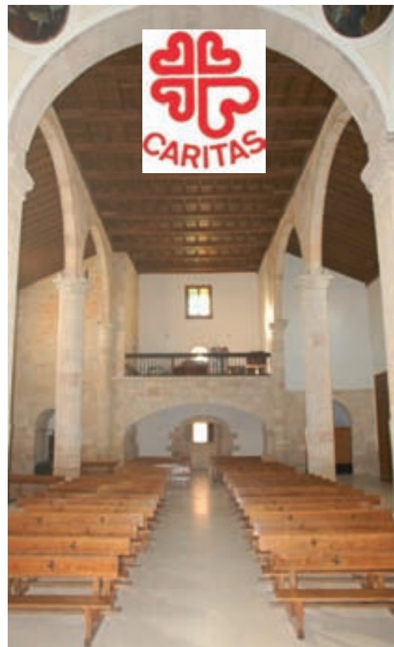
Vista de la Iglesia Parroquial de San Pedro Apóstol