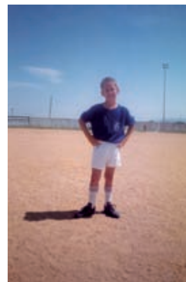
Sus comienzos en el C.D. Yunquera