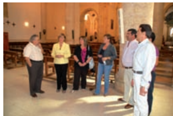
La Consejera visitó admirada el templo parroquial

El interior de la iglesia parroquial de Yunquera de Henares, obra de Nicolás de Ribero y en la que participan dos de los maestros más importantes del siglo XVI español, Alonso de Covarrubias y Rodrigo Gil de Hontañón, ya fue objeto de una reforma de gran calado. Unas actuaciones que recuperaron numerosos elementos que habían permanecido ocultos durante años. En 1996, se inauguró la restauración, que según recuerda Don Antonio de Gregorio, re realizó con cargo al propio municipio, aunque se contó con algunos pequeños apoyos. Fueron muchos los esfuerzos, donaciones de particulares, tómbolas, corrida de toros, etc., que se realizaron para poder costear las obras, pero mereció la pena. Entre las mejoras que se realizaron se incluye la modificación de la techumbre con la recuperación de un artesano y el descubrimiento de varios arcos en las tres naves del templo. Esto fue posible gracias a la retirada de los falsos techos que cubrían la parte superior de la iglesia parroquial. También se actuó en la parte posterior de la nave principal, donde se ha habilitado un amplio espacio para la ubicación del coro al cual se accede por la recién construida escalera de caracol.