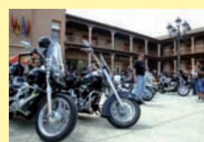
Harleys en Yunquera