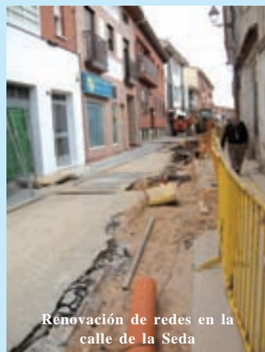
Renovación de redes en la calle de la Seda

El Consistorio ha puesto en marcha las obras relativas a la primera fase de la renovación de redes de saneamiento del municipio. Según lo indicado en el proyecto inicial, cinco son las calles del casco urbano en las que se se van a realizar el grueso de estos trabajos: la Ronda de San Antonio (ya concluida), calle La Seda (en plena obra), El Cerrojo, Real y El Santo. El crecimiento de la población unido a la antigüedad del material de algunas redes, han obligado al Consistorio campañero a dicha inversión, que aún siendo muy molesta, por la cantidad de calles que se deben cortar al tráfico mientras duran las obras, será muy beneficiosa para evitar atascos e inundaciones. Desde el Consistorio se pide paciencia y disculpas a los ciudadanos por la cantidad de molestias que se originan en la realización de este tipo de obras.