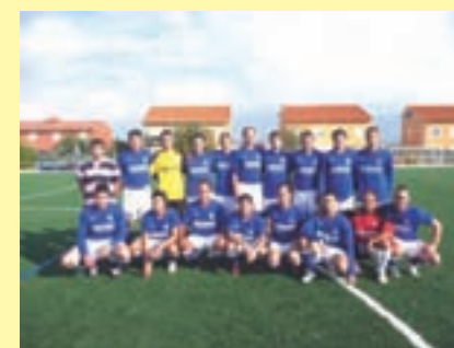
C.D. Yunquera, objetivo: 1ª