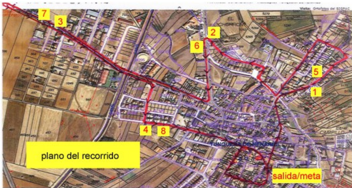
Plano del recorrido